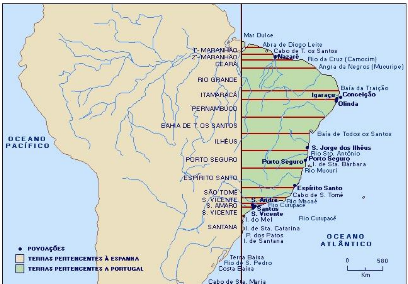
The Capitánias of Brazil

Cette carte montrant l'extension théorique de l'empire espagnol dans les années 1650, illustre le méridien défini lors du traité de Tordesillas; à l'est se trouve la zone terrestre dévolue à l'empire colonial portugais.